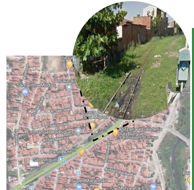
Setor próximo à estação São Miguel (Linha Oeste)