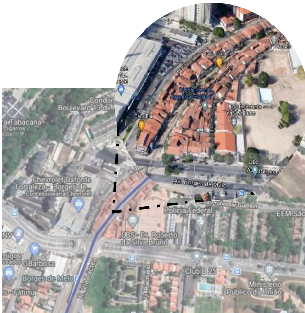
Setor após Av. Borges de Melo (Sentido Mucuripe, VLT PARANGABA-MUCURIPE)