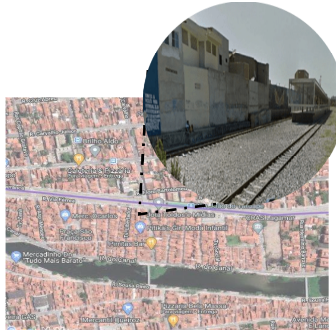
Setor próximo à estação São João do Tauape (VLT PARANGABA-MUCURIPE)